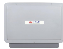
【パワーコンディショナ】