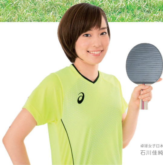
卓球女子日本代表 石川佳純